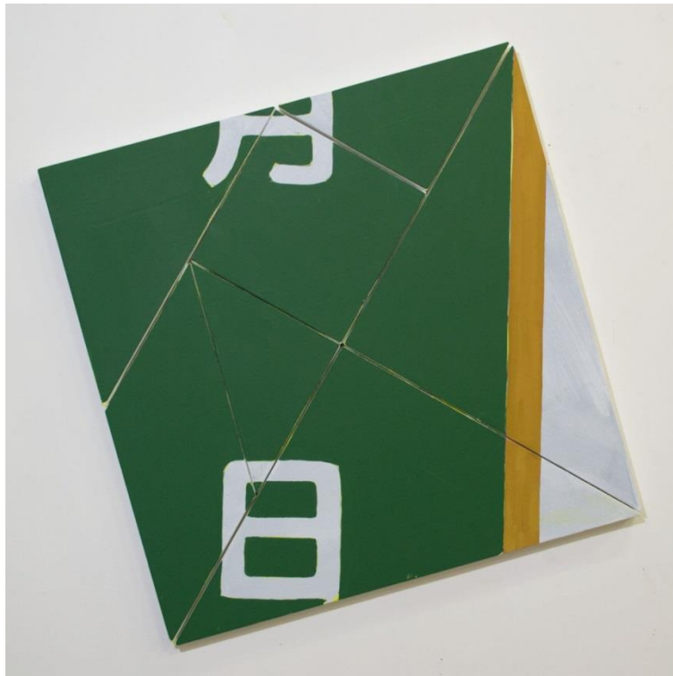
末永史尚「Tangram Painting (黒板)」 2014年、パネル、キャンバスに顔料、アクリル 60 × 60cm(サイズ可変)

Email: info@makifinearts.com Tel : +81-(0)3-6806-0615