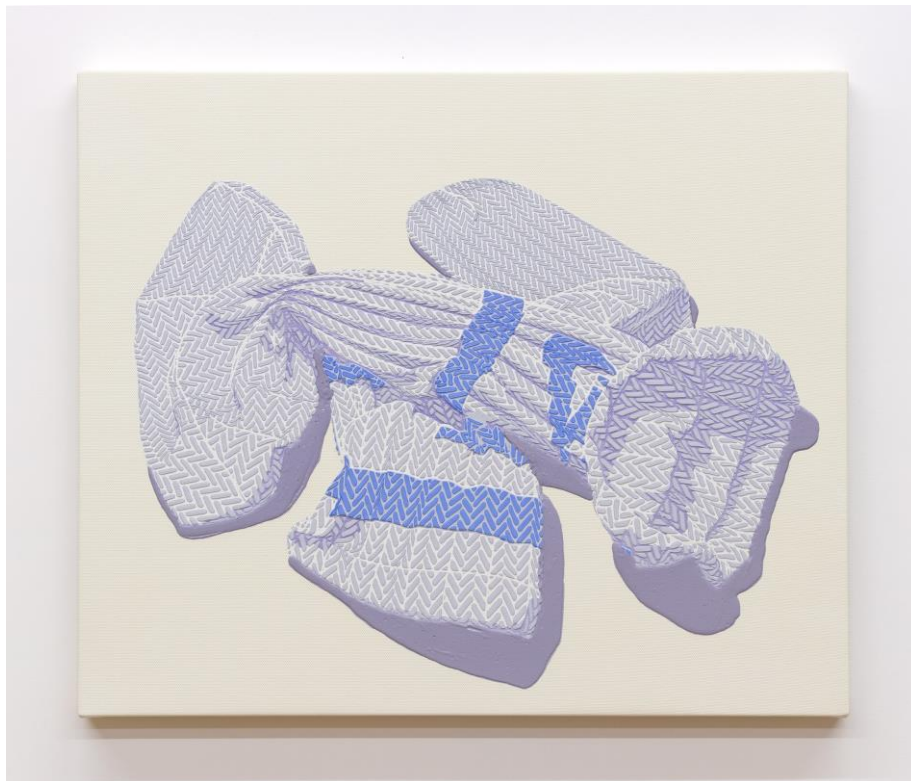
Alex Dodge / アレックス・ダッジ Soft Power for Hard Problems (Nike) I 2020, oil on canvas 38 x 45.5 cm